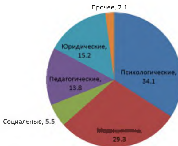
Рисунок 3 – Обращения граждан по тематике, в %

Функционирование такого проекта необходимо для того, чтобы, объединяя усилия большинства специалистов, обеспечить качественное медицинское обслуживание в отдаленных населенных пунктах страны, в том числе оказывать квалифицированную психологическую помощь семьям, имеющим детей-инвалидов.