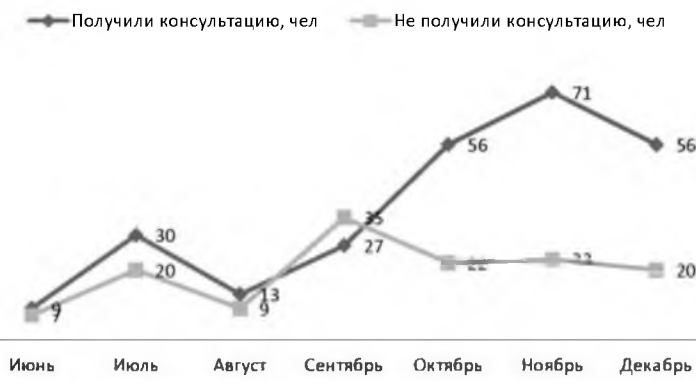
Рисунок 1 – Обслуживание заявок Call-центром

развитие ребенка-инвалида не может рассматриваться как фатально обусловленный процесс. Формирование личности детей с ограниченными физическими и умственными возможностями открыто влиянию всех благотворных перемен как в объективных, так и в субъективных условиях этого процесса [3].